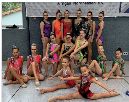
Gruppenbild mit allen RSG-Teilnehmerinnen

nische Fehler, was sich dann stark in den Abzügen niederschlägt.