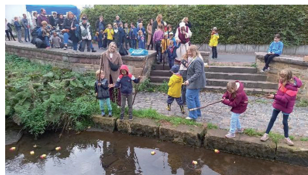
Die Fische schwimmen wieder und die Kinder angeln sie heraus