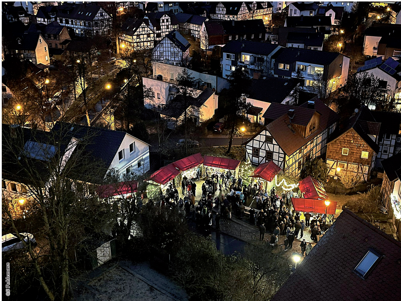
Märchenviertel Niederzwehren mit traditionellem Weihnachtsmarkt aus der Sicht des Türmers

Wir wünschen allen Mitgliedern und Freunden der TSG 87 eine schöne Weihnachtszeit und einen guten Rutsch ins Jahr 2026.