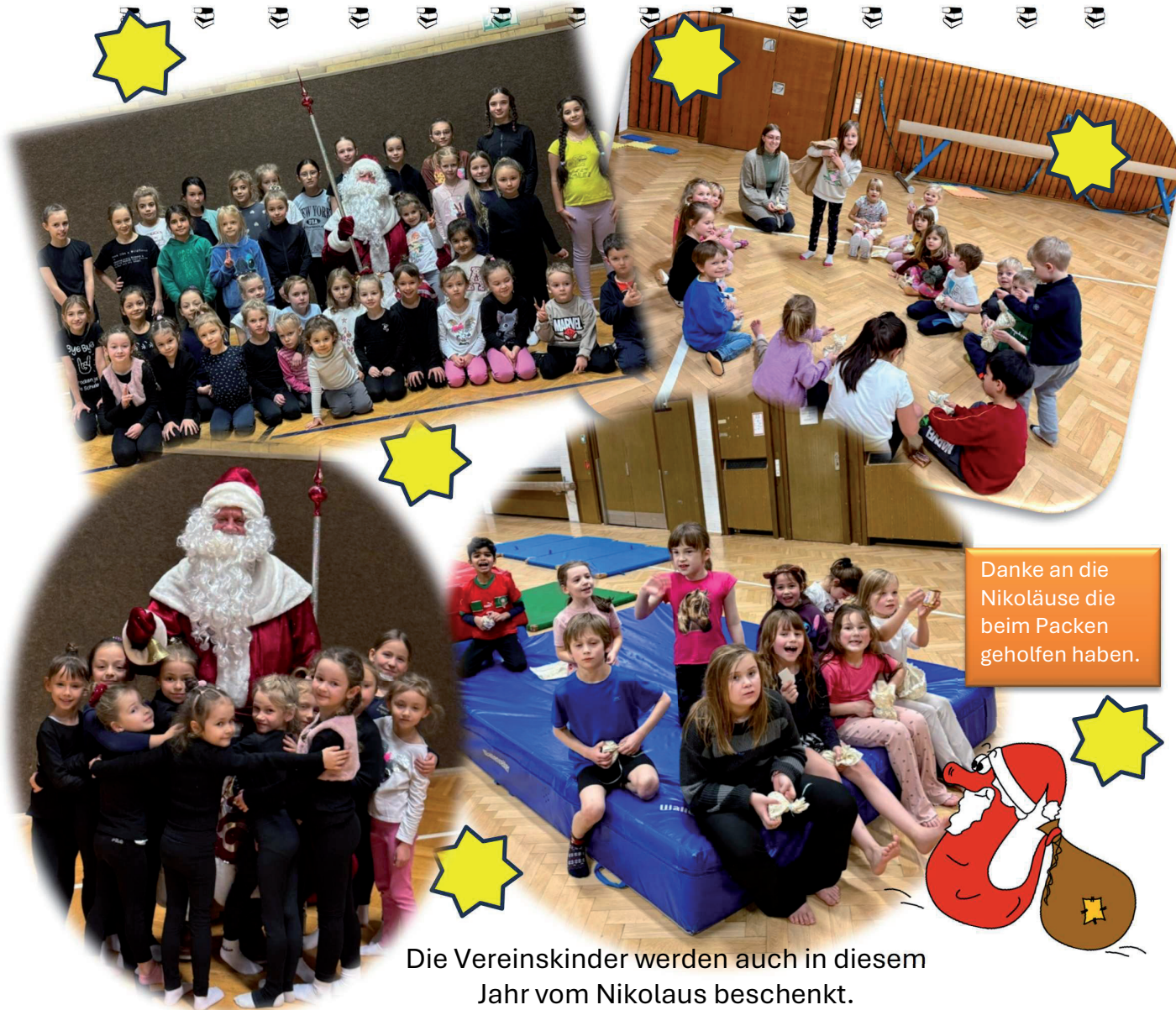
Die Vereinskinder werden auch in diesem Jahr vom Nikolaus beschenkt. Hier die RSG und das Kinderturnen.