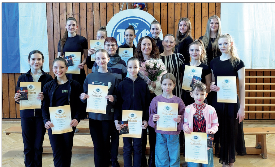
Seit Jahren immer wieder erfolgreich: Die Mädels der Rhythmischen Sportgymnastik