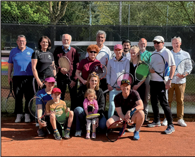
Nach Frühjahrsinstandsetzung der TSG-Tennisanlage können sie endlich wieder "Open-Air-Tennis" spielen