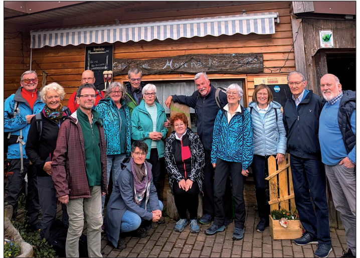
Die fröhlichen Gesichter lassen darauf schließen: Es gibt sie immer noch, die riesigen Tortenstücke im Café Hasenacker nahe Naumburg